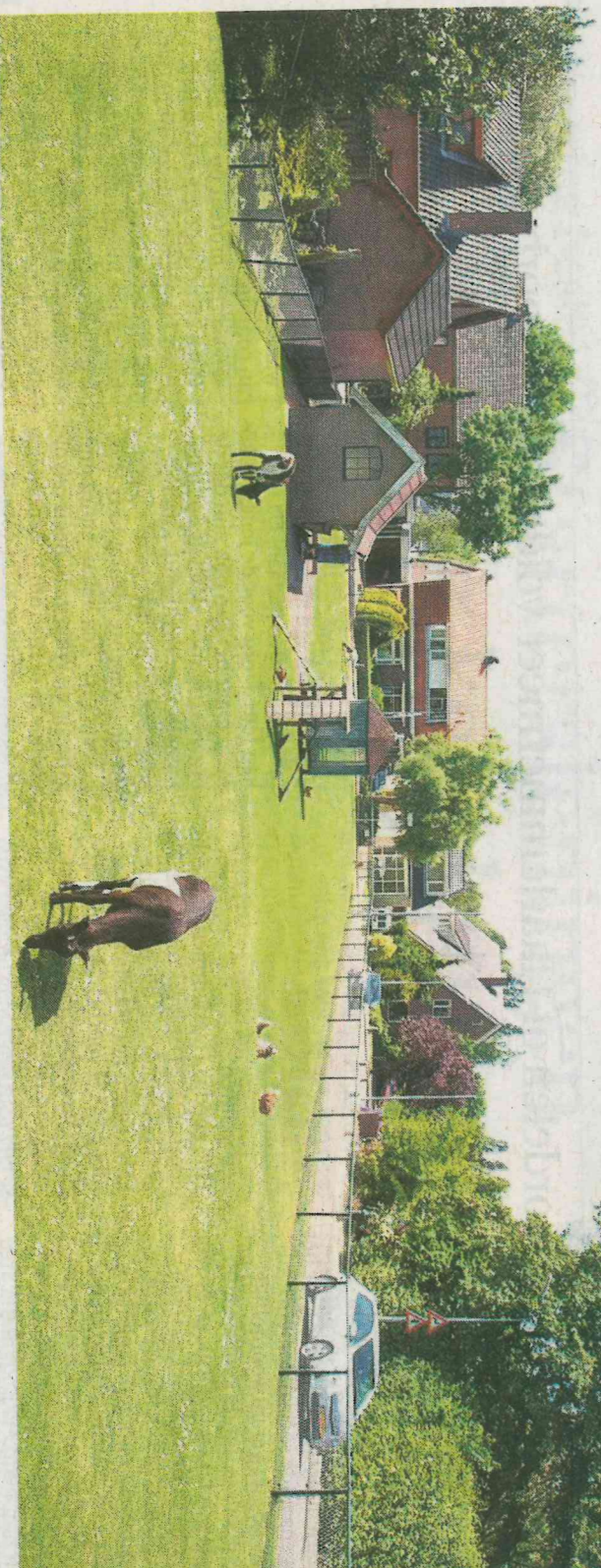
Een gettenweijte midden in het dorp.

Het gemaal De Lijnden, vernoemd naar poliermeerpolder oorspronkelijk een hoofddorp had moeten worden, naast Hoofddorp en Nieuw-Vennep. „Hier staat School 1 en de eerste rooms-katholieke kerk van Haarlemmermeer”, zegt de voorzitter. „Maar we hebben nooit een dorp aan de andere kant van de Ringvaart gehad. Daar ligt de Lutkenneerpolder en dat was een lege polder.” Het verkeert is, net als elders in de polder, wel een pro-