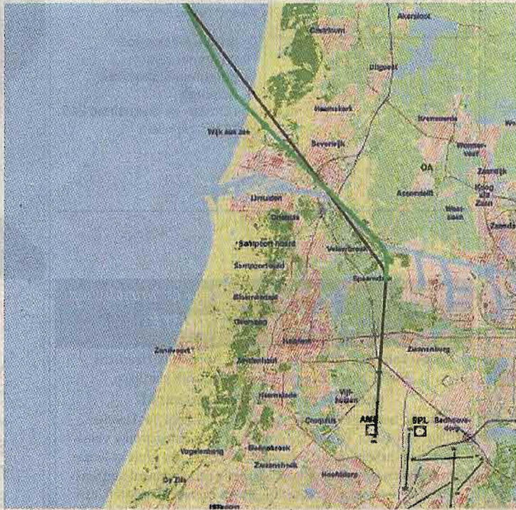
De groene vertekroute vervangt voorlopig de zwarte. ILLUSTRATIE CROS

Een aantal vertekroutes overdag wordt verlegd om woonbebouwing te ontzien. Vliegtuigen gaan langer over