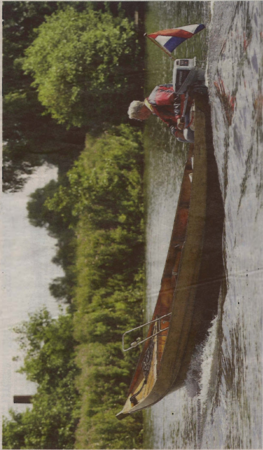
In Aalsmeerderbrug blijft nog genoeg over om van te genieten, zoals een boottochtje op de Ringvaart.